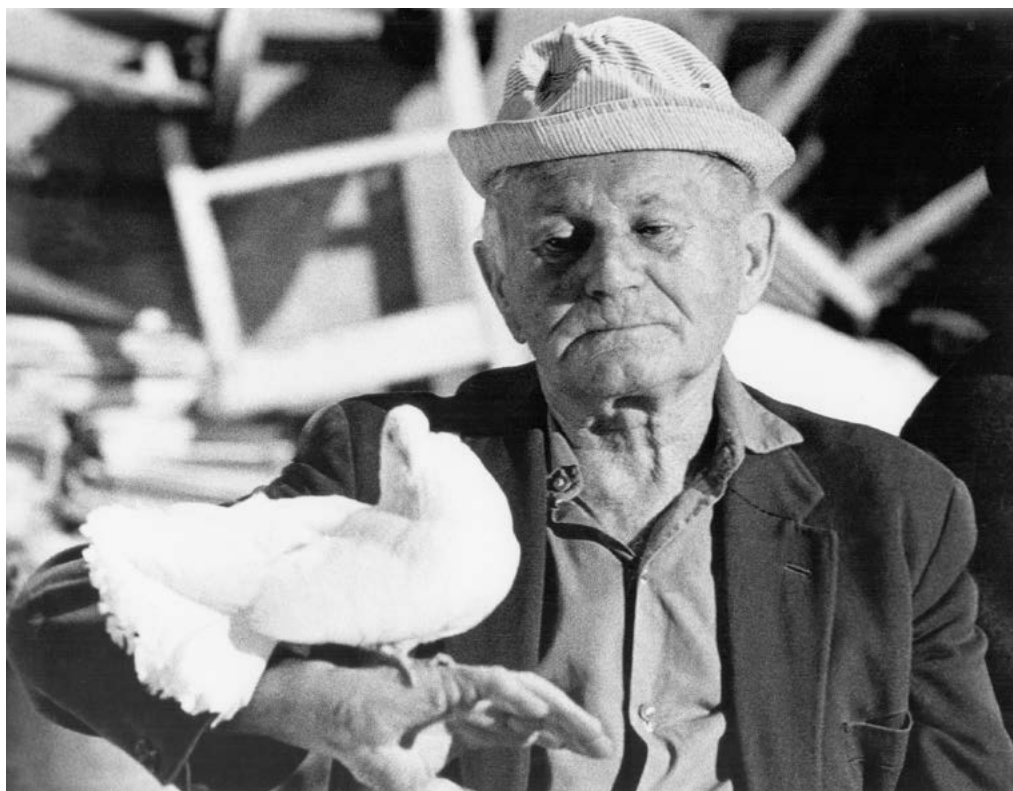
Bohumil Hrabal.

Hrabal říká, že počátkem umělecké tvorby je platónský údiv, řecky thauma . Řecké slovo thauma je velmi zajímavé. Znamená totiž zároveň úžas i zázrak. Je to údiv nad divem. Údiv je v hlavě a div je tam venku. Přesně jako u anglického slova wonder , které taky označuje zároveň úžas i zázrak. Co tedy znamená, že počátkem umělecké tvorby je podle Hrabala platónské thauma , tedy úžas/zázrak? Asi toto: Člověk, který není schopen úžasu, nikdy žádný zázrak neuvidí. Naopak ten, který umí žasnout, dokáže spatřit zázračný třpyt i v obyčejných věcech všedního dne. Nebo jinak: Malé dítě, které dosud nespatriilo kočku, psa, vrabce nebo holuba, nemá tušení, že tito bájní tvorové existují. Neví, že jsou „obyčejní“. Žasne, když je vidí. Hledí na ně se stejnou mírou radosti a úžasu, jako později v zoologické zahradě na